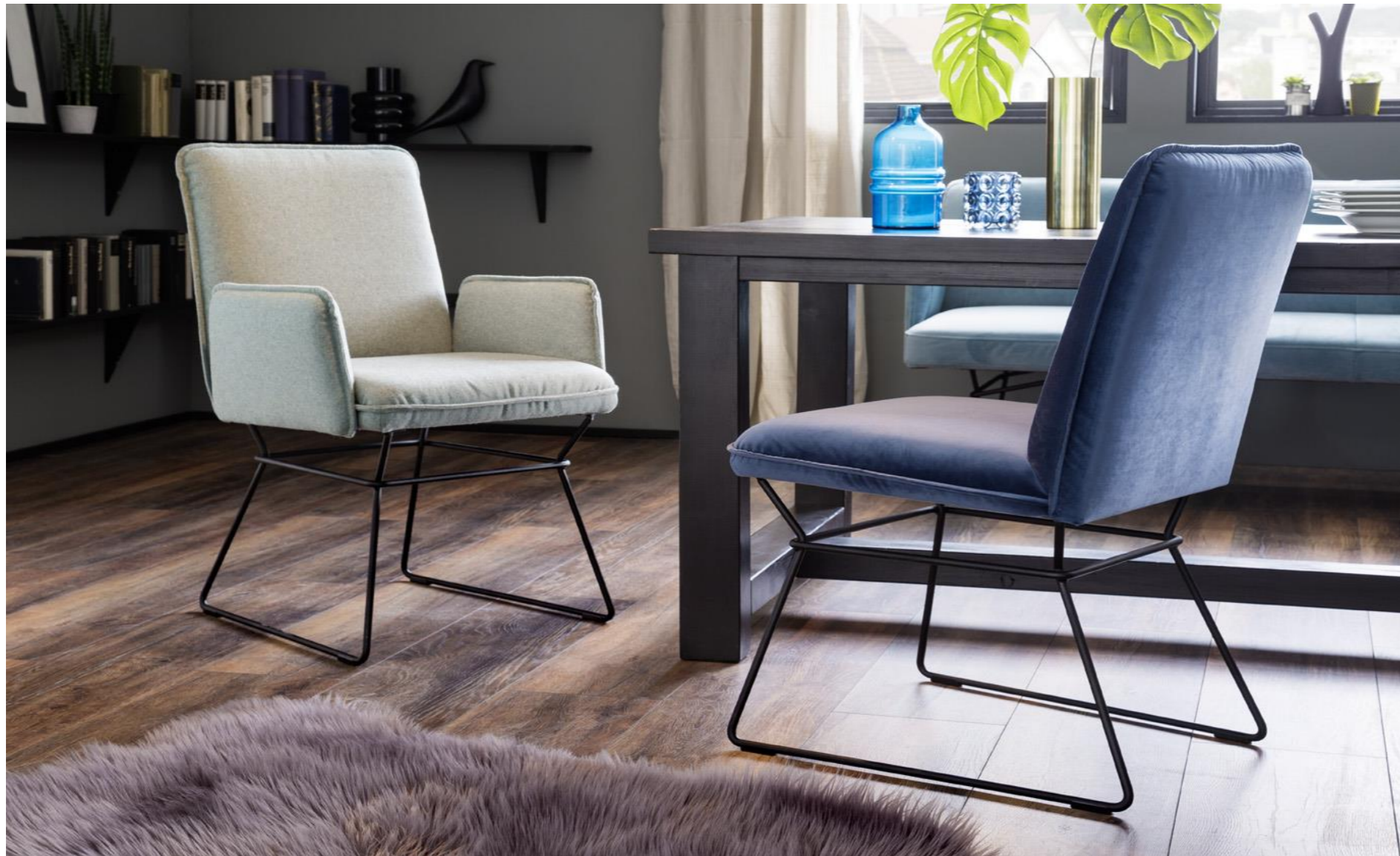
Armlehnstuhl im Bezug Darran green und Stuhl im Bezug Velvet blue grey