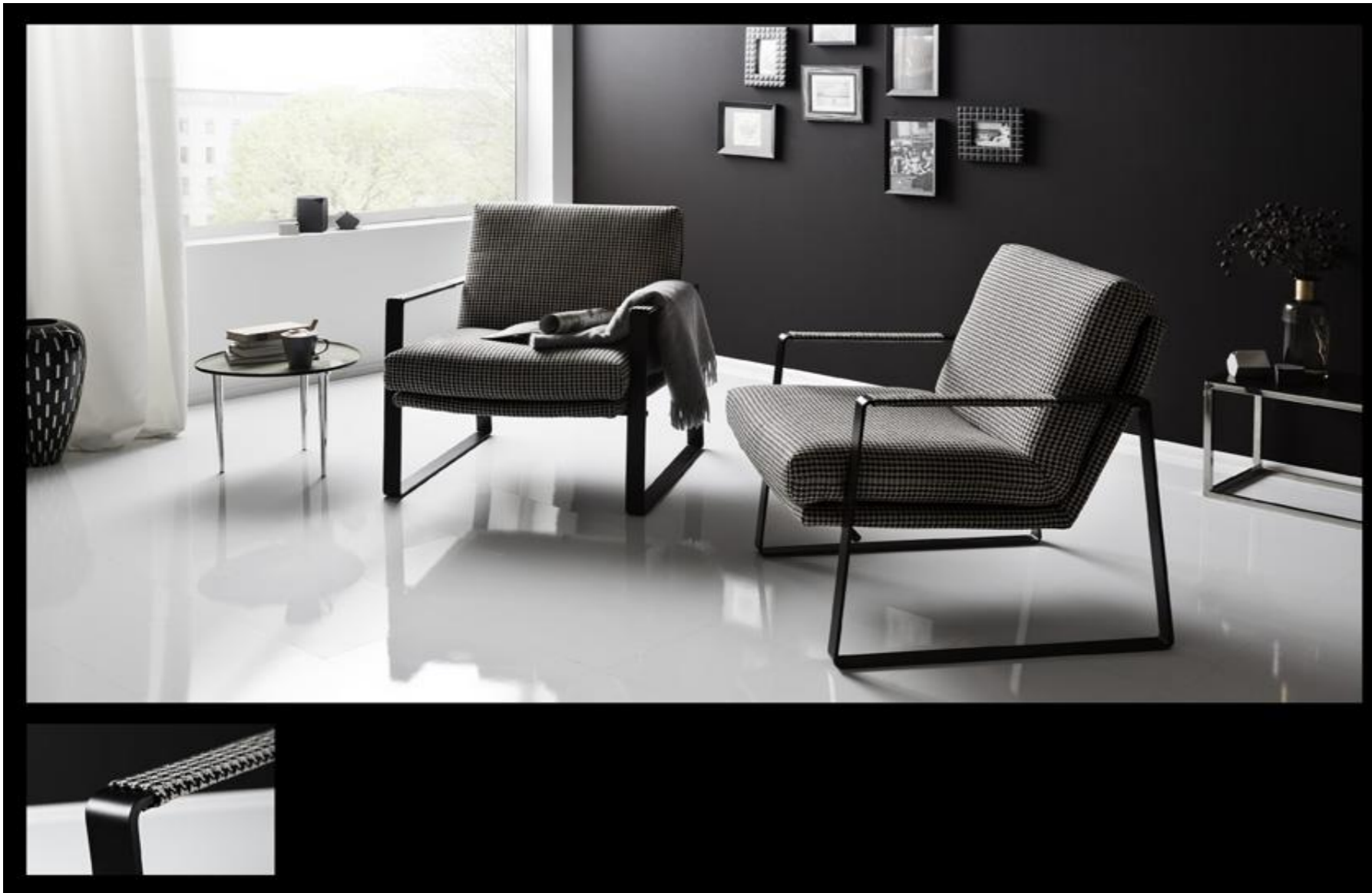
Einzelsessel im Musterstoff